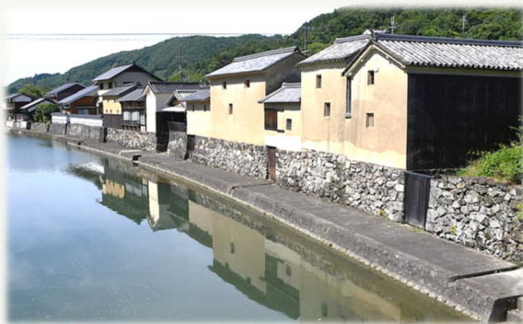
宿場町平福の川端風景

主催：姫新線利用促進・活性化同盟会 協力：佐用山城ガイド協会、平福観光ガイド協会