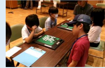
丹波ブロック子ども会オセロ大会