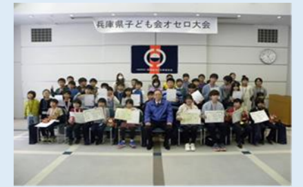
兵庫県子ども会オセロ大会