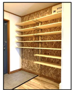
ベビーカーも置ける 玄関収納