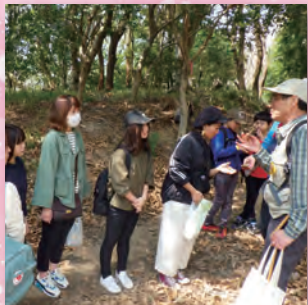
楽しい自然観察会