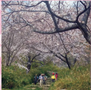
金鳥山付近の桜のトンネル