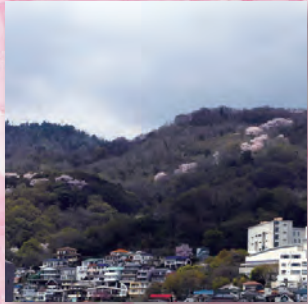
本山南町から望む岡本桜回廊