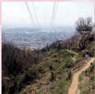
薬大尾根からの眺望

このチラシは2023年度(公財)コープともしびボランティア振興財団からの助成を受けて作成しています。