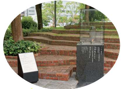
★ 1.17 希望の灯り