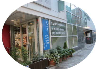
★ こうべまちづくり会館