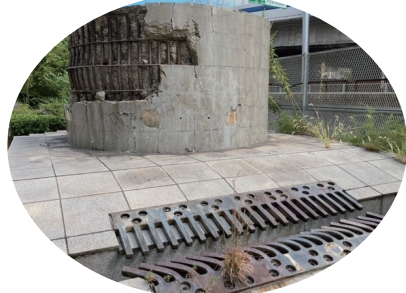
★ 被災した浜手バイパスの橋脚