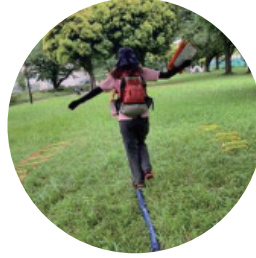
落ちたら危ない 細い一本道渡り