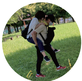
膝あげて 障害物を越えよう