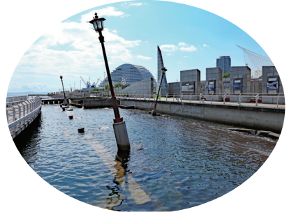
★ 神戸震災メモリアルパーク