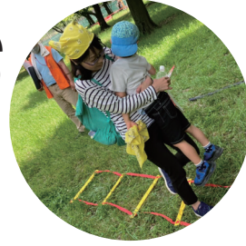
大股歩きでガレキを避けよう