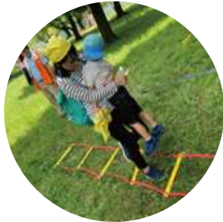
大股歩きで ガレキを避けよう