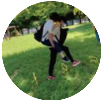
膝あげて 障害物を超えよう