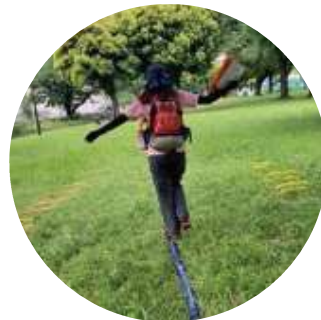
落ちたら危ない 細い一本橋渡り