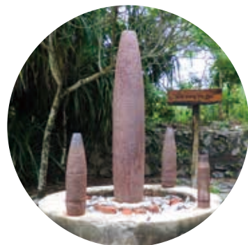
キャノンフォート（戦争遺跡）