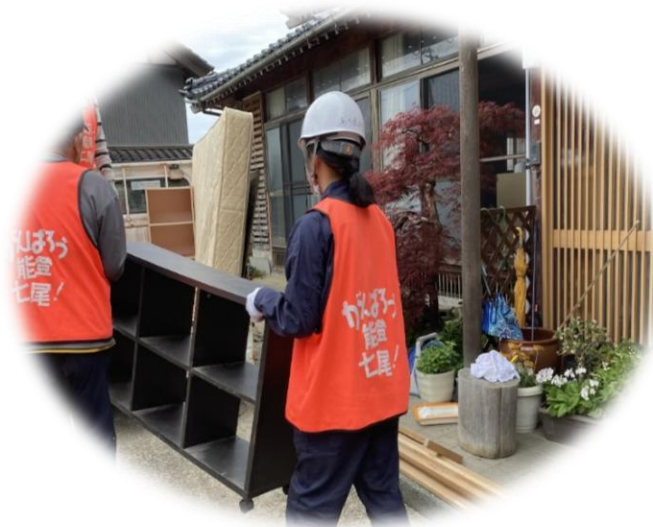
被災家屋の災害ゴミの片づけ (石川県七尾市)