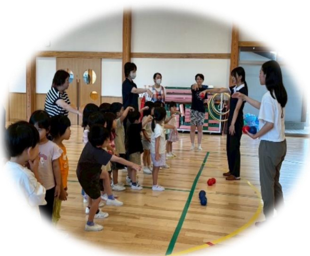
子どもたちと「ポッチャ」などを通じて交流 (石川県珠洲市の保育園)

電話078-360-8845 Eメールアドレス vpplaza@hyogo-wel.or.jp