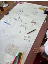
(写真2) レクリエーションの様子