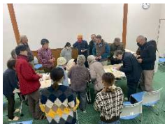
(写真3) おはなし会の様子