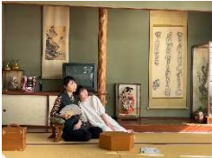
(写真1) 演劇作品上演の様子