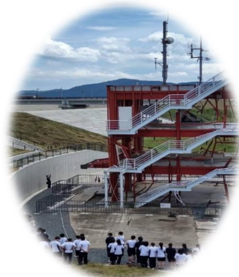
防災学習 (南三陸町旧防災庁舎)

電話078-360-8845 Eメールアドレス vpplaza@hyogo-wel.or.jp