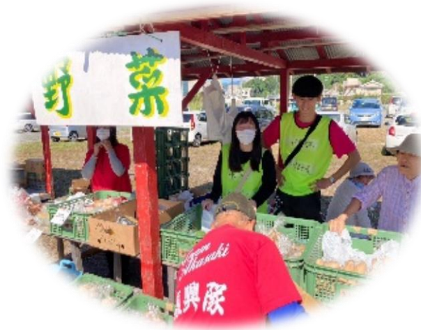
大船渡市「赤崎復興市」のお手伝い