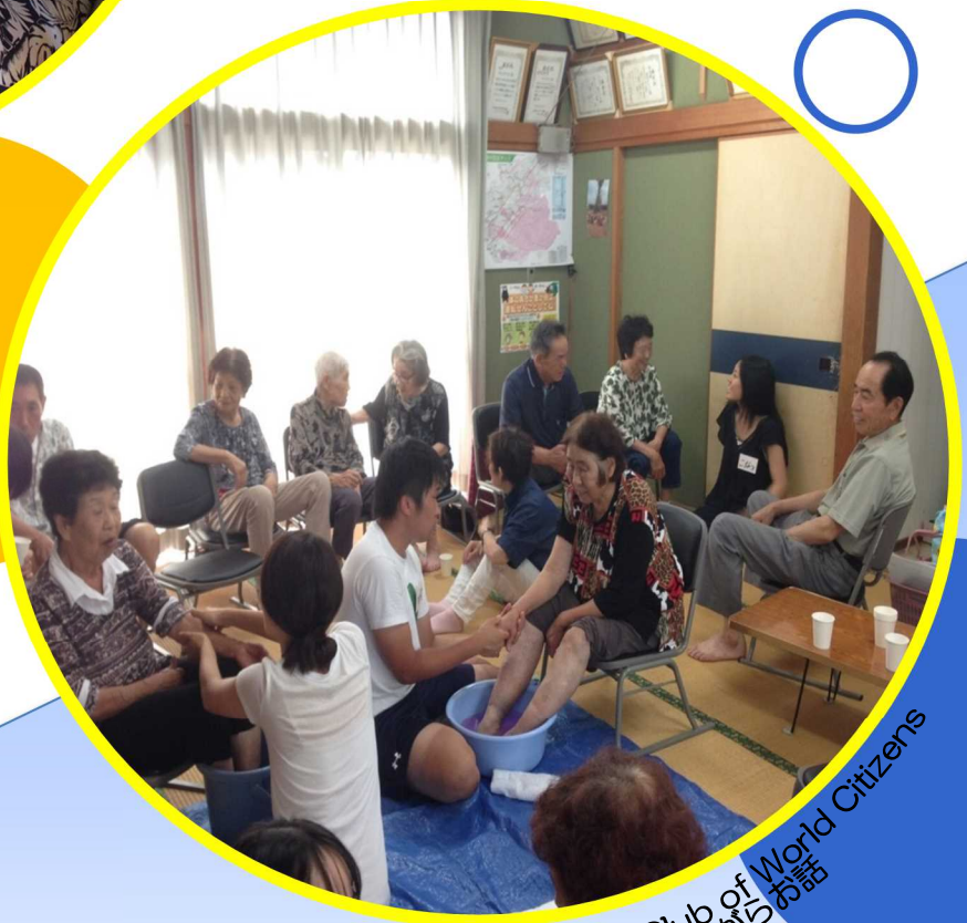
関西学院大学 Club of World Citizens 避難所で足湯をしながらお話し