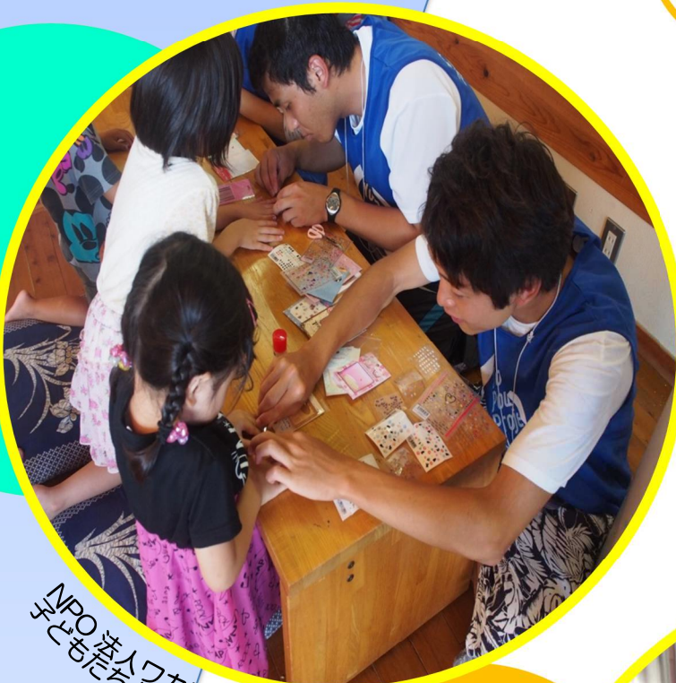
NPO法人ワカモノチカラプロジェクト 子どもたちと折紙

皆様からの寄附を活用し、県内の高校・大学生など、多くの若者のグループ・団体が、被災者の暮らしやまちの復興、励ましなど被災地の復旧・復興を応援する活動を行っています。