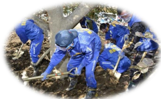
泥だし作業(長野県長野市)

電話078-360-8845 Eメールアドレス vpplaza@hyogo-wel.or.jp