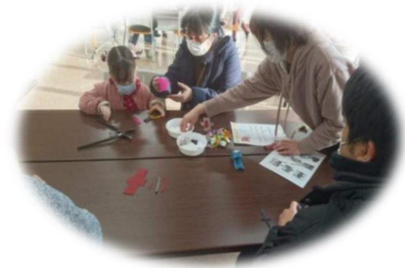
「ミニチュアランドセル」作り(宮城県女川町)