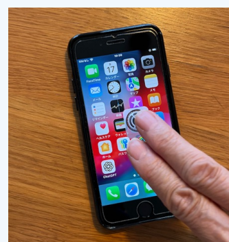
2本指で操作している様子