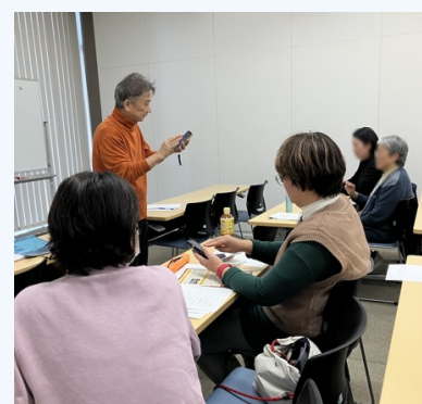
サポーター研修会の様子

研修1（基礎編）：読み上げ機能（ボイスオーバー）の基本操作実習 研修2（活用編）：読み上げ機能の便利な使い方と便利アプリ体験